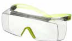
SF3701SGAF-GRN Lencse: víztiszta Keret színe: szürke/lime-zöld