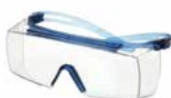
SF3701SGAF-BLU Lencse: víztiszta Keret színe: kék/kék