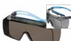
SF3702XSGAF-BLU Lencse: szürke Keret színe: szürke/kék