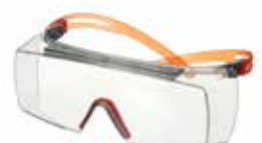
SF3701SGAF-ORG Lencse: víztiszta Keret színe: szürke/narancs