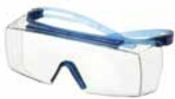
SF3701ASP-BLU Lencse: víztiszta Keret színe: kék/kék