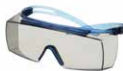
SF3707SGAF-BLU Lencse: bel- és kültéri szürke Keret színe: kék/kék