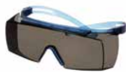
SF3702SGAF-BLU Lencse: szürke Keret színe: kék/kék