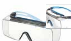
SF3701XSGAF-BLU Lencse: víztiszta Keret színe: szürke/kék