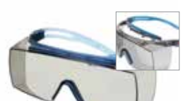
SF3707XSGAF-BLU Lencse: bel- és kültéri szürke Keret színe: szürke/kék