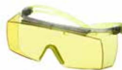
SF3703SGAF-GRN Lencse: borostyánszínű Keret színe: szürke/lime-zöld